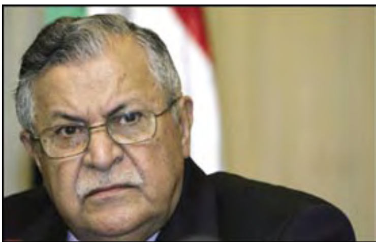
Riba foto di archivo, por mira presidente di Iraq, Jalal Talabani, contestando algun pregunta.

EL CAIRO—E forsanan principal politico Iraqui, ta reuni diasabra na El Cairo bou di e auspicio di e Liga Arabe, pa sinta e basenan di un reconciliacion nacional. Aunke e obhetivo oficial di e reunion di tres dia ta acorda e orden di dia di e conferencia di reconciliacion nacional, tambe mester permiti pa lima diferencia entre e Iraquinan. “